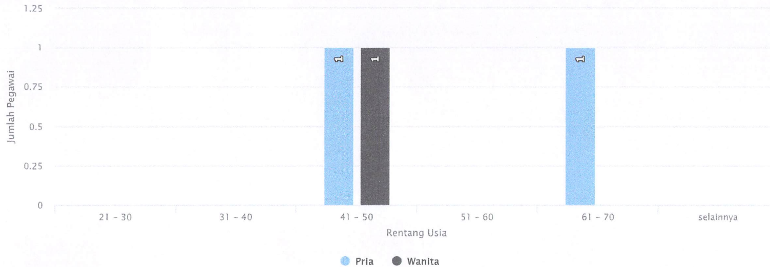
Grafik Pendidikan dan Pelatihan Tahun 2020

(/laporan/pendidikan-pelatihan/print) (/laporan/pendidikan-pelatihan/index)